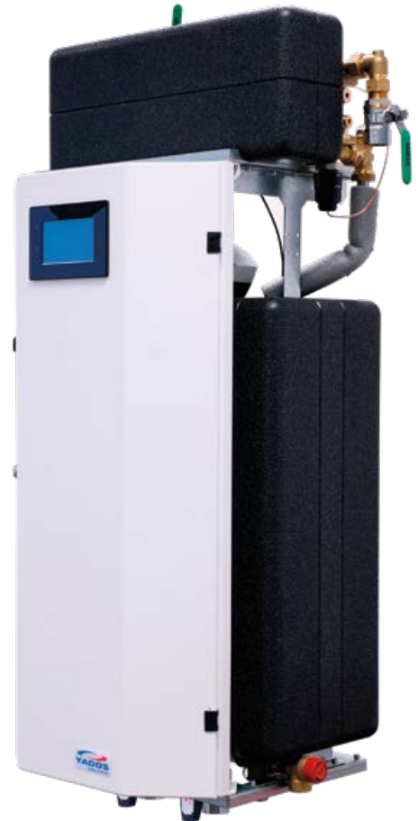
Abbildung: YADO|GIRO C mit Durchflusssystem* (*optionale Ausstattung)

Fotos und Produktzeichnungen beinhalten auch Sonderausstattungen. Irrtum und technische Änderungen vorbehalten. Texte, Tabellen und grafische Darstellungen dienen ausschließlich dem besseren Verständnis. Sie sind keine Grundlage für Planungen. Nachdruck oder Vervielfältigung, auch auszugsweise nur mit Genehmigung der YADOS GmbH, 02977 Hoyerswerda, GERMANY.